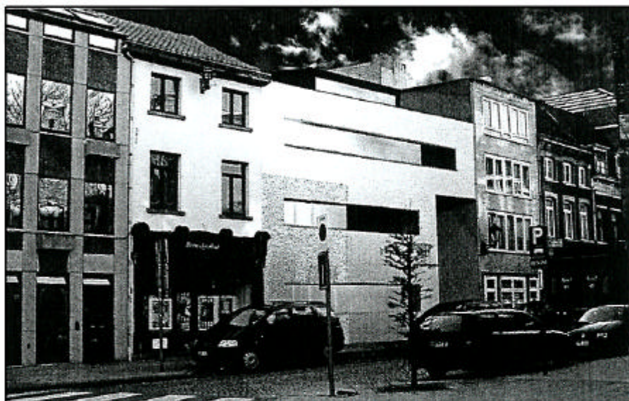
Computersimulatie van de residentie Merode: vier appartementen en autostaanplaatsen halverwege de Frederik de Merodestraat.

In juli 2005 kreeg City II Site NV de bouwvergunning voor 4 appartementen en autostaanplaatsen halverwege de